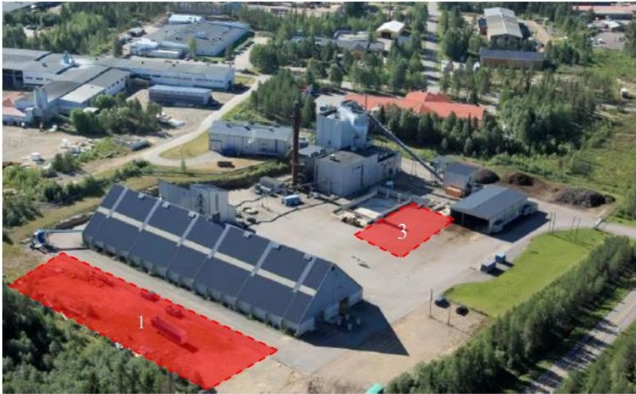
Kuva 2. Kuva Haapaveden voimalaitosalueesta. Varastoalueet 1 ja 3 merkitty kuvaan punaisella rajauksella.