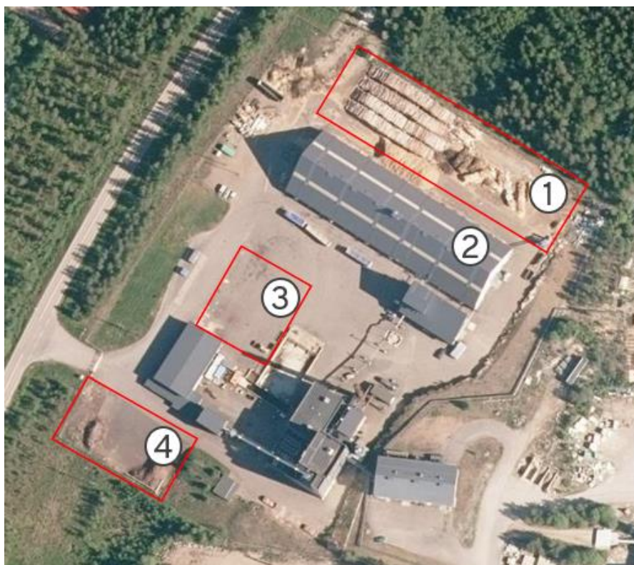
Kuva 1. Haapaveden voimalaitoksen polttoaineiden varastointialueet.

Täten Nevel Oy hakee muutosta lupamääräyksiin 12 ja 22, siten että määräys sallii kokopuun varastoinnin voimalaitosalueella sekä asfaltoidulla että tiivispohjaisella varastoalueella. Lupamääräyksen 22 tulee sallia varastoida alueen 1 varastokentällä asfaltoidulla sekä tiivispohjaisella alueella kokopuurankaa 7 000 kiinto-m 3 .