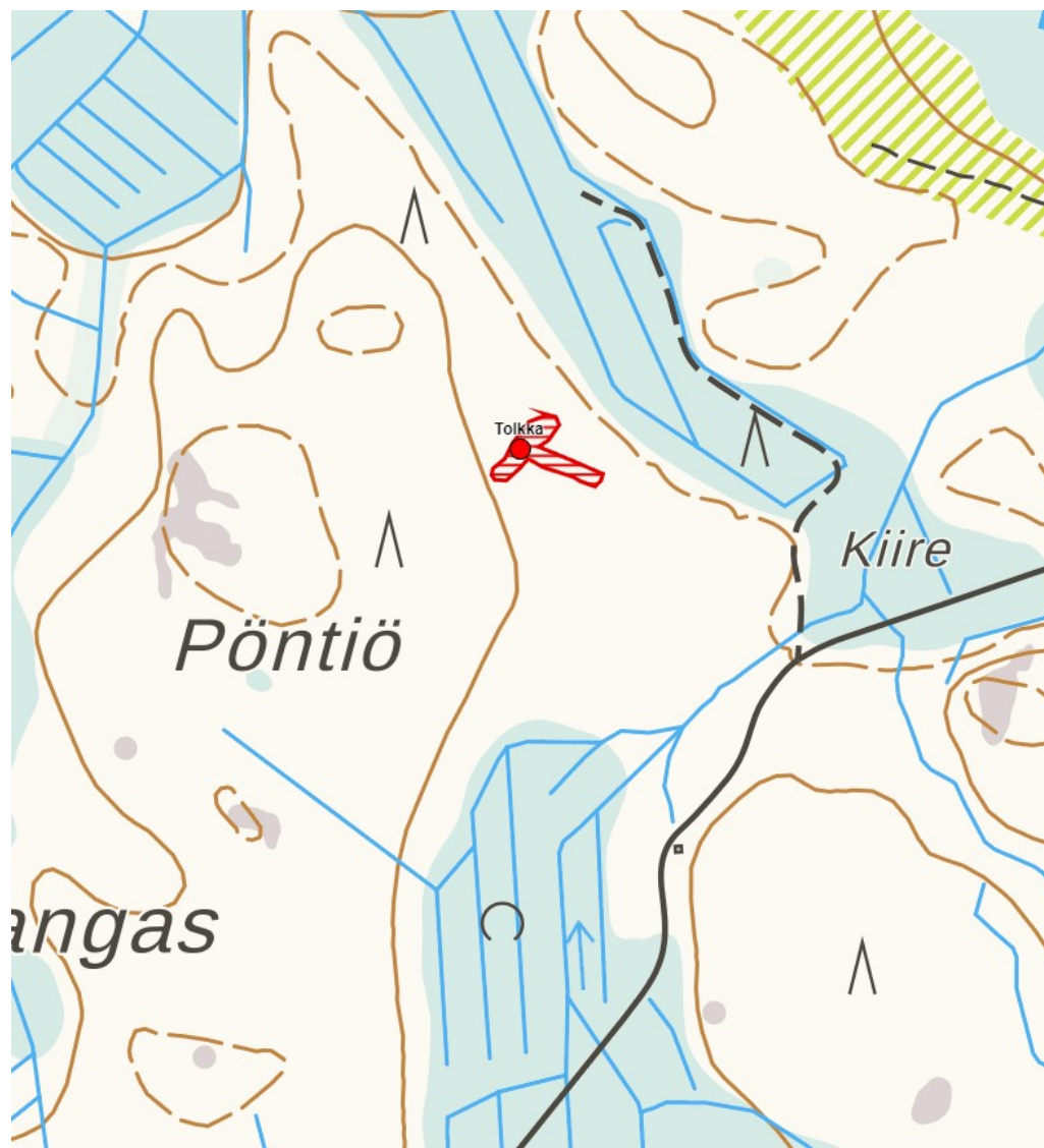
Kohde Tolkka on merkitty karttaan punaisella pisteellä ja sen muinaisjäännösalueen rajaus punaisella rasterilla.