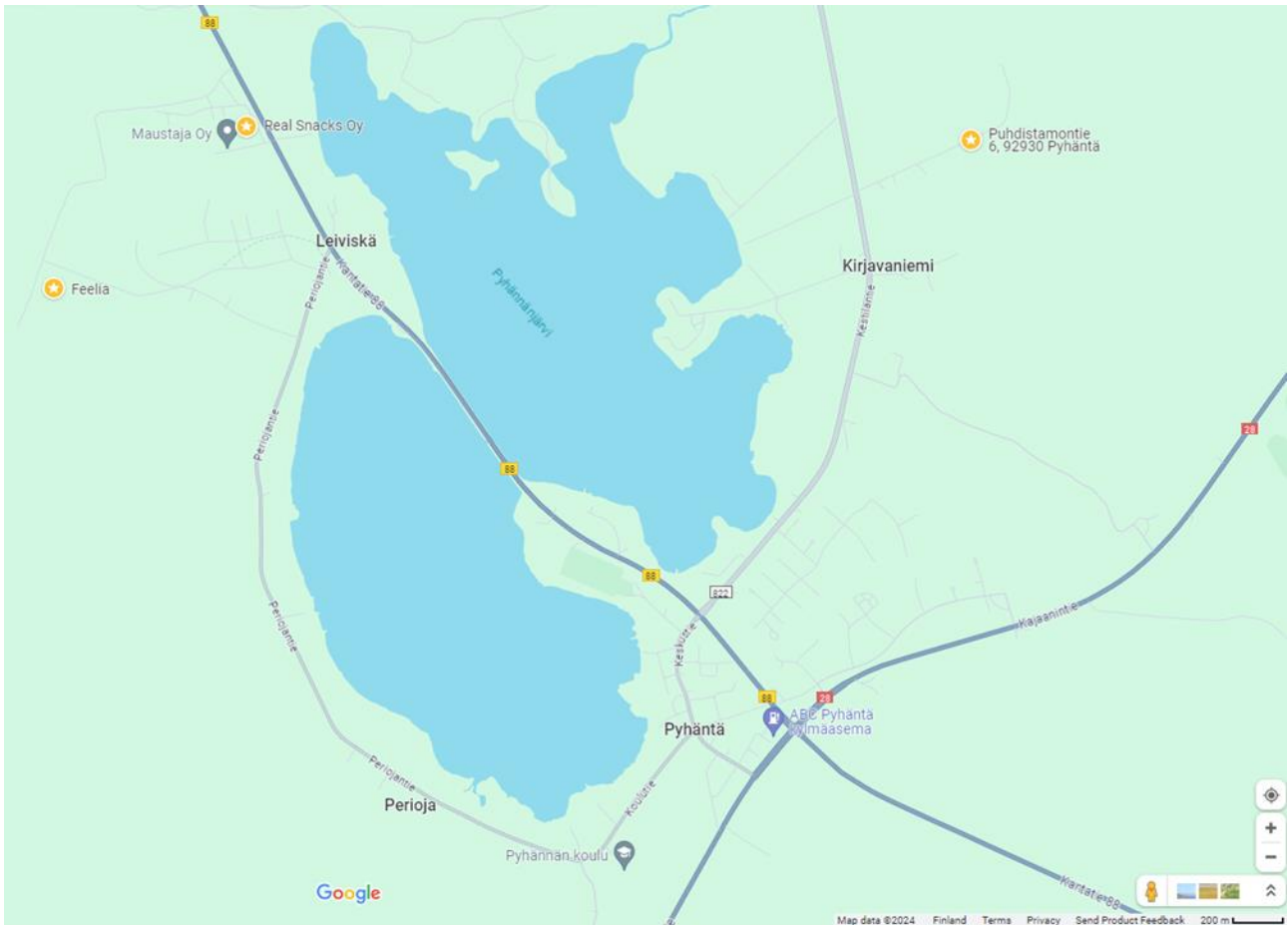
Kuva 2. Leiviskänkankaan teollisuusalueen, Pyhäntän kunnan keskustan ja esikäsittelylaitoksen sijainnit kartalla.